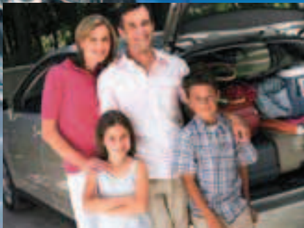
Kraftvoll starten zu jedem Ziel