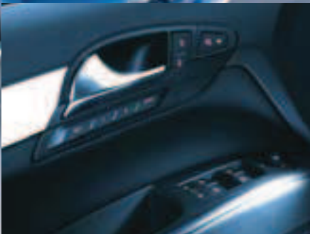
Elektrischer Fensterheber und Außenspiegel