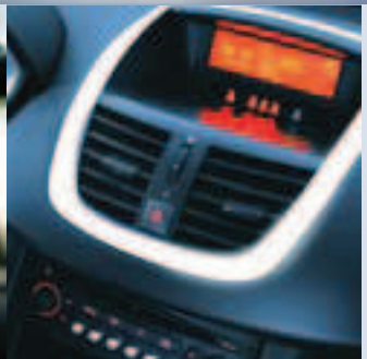
Radio und Armaturendisplay