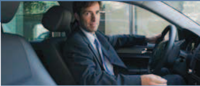
Besondere Sicherheit für anspruchsvolle Kunden

Mehr Kaltstartleistung, mehr Leistungsreserve, mehr Sicherheit: Für den anspruchsvollen Kunden ist die zuverlässige Versorgung elektrischer Zusatzausstattung ein wichtiger Faktor der Batterieauswahl. Die Bosch-Batterie S5 ist hier besonders für Fahrzeuge neuerer Generationen geeignet, da sie die hohen Hersteller-Anforderungen für die Erstausrüstung erfüllt und oft sogar übertrifft. Silver-Technologie und Reservekapazität erhöhen die Batterielebensdauer erheblich.