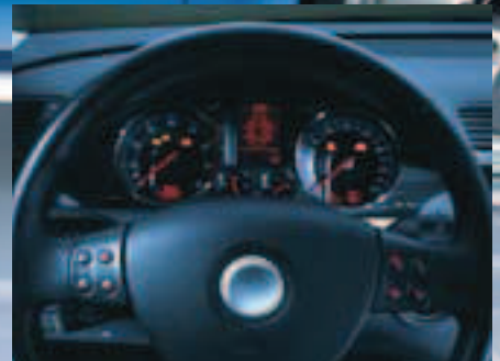
Cockpit- und Lenkradelektronik