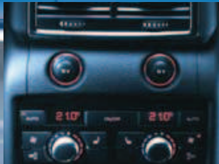
Elektrische Sitzheizung hinten